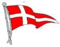
Circolo Nautico Torre del Greco